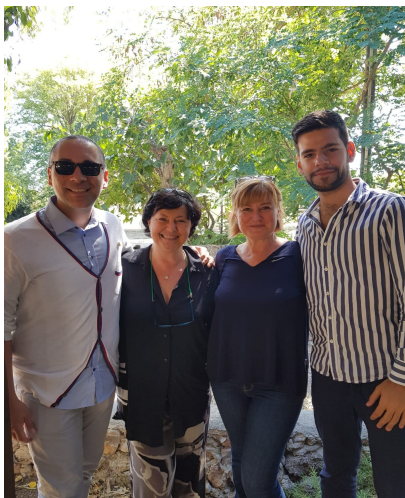
Alcuni scatti del "service" giunto alla sesta edizione, della durata di una settimana.

Proiezioni di film sulla diversità, passeggiate notturne, spettacoli teatrali e di magia, tutte azioni inclusive per consentire a tutti i presenti con le diverse abilità a partecipare.